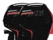
PRO XS® 115 PS