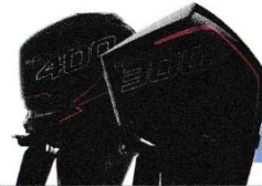
RACING 400 - 250 PS