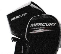
FOURSTROKE® 225 - 150 PS