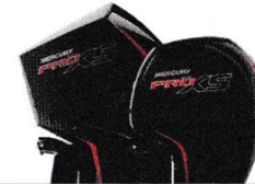
PRO XS® 300 - 150 PS